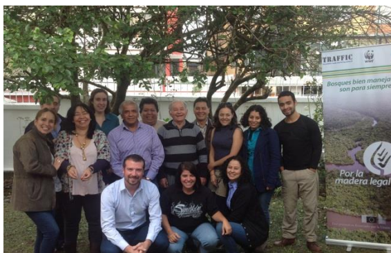
Reunión Regional, Noviembre 2013. Quito - Ecuador

Las publicaciones que se mencionan en este boletín han sido elaboradas en el marco del proyecto “Apoyar la aplicación del Plan de Acción FLEGT de la Unión Europea en América del Sur: Catalizar iniciativas para controlar y verificar el origen de la madera en el comercio y apoyar las mejoras en la gobernanza forestal en América del Sur”, financiado por la Unión Europea y liderado por TRAFFIC en colaboración con sus socios: UICN Sur y WWF Colombia.